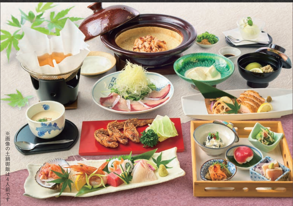
※画像の土鍋御飯は4人前です