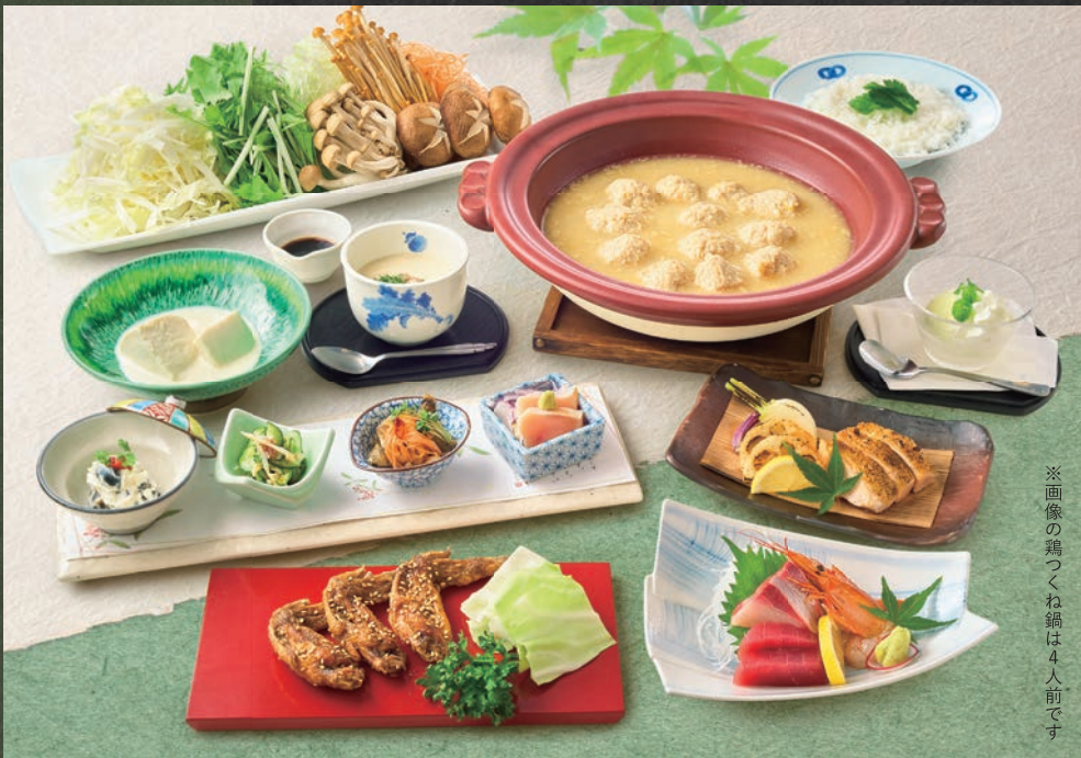
※画像の鶏つくね鍋は4人前です

看板メニューの水炊き鍋に総州古白鶏のローストなど 鶏の美味しさをシンプルに味わっていただける 素材を活かした鶏づくしコースです。