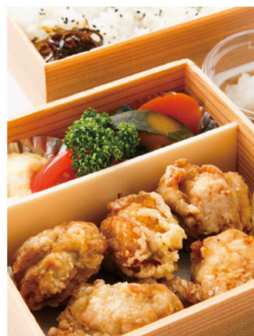
鶏唐揚げおろしポン酢弁当