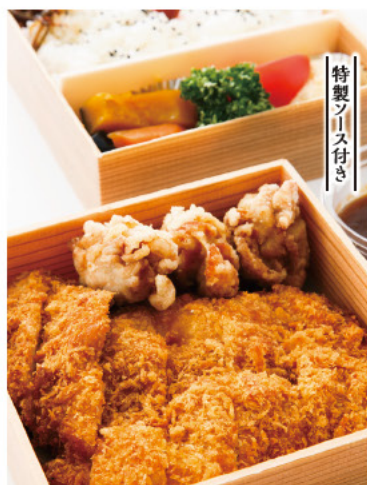
チキン・チキン弁当