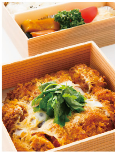
チキンカツ煮弁当