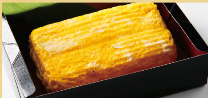
こだわり手巻きの だし巻き玉子